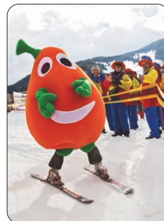
Léo Le Lysosome dans la course.

Lysosomales « Nous sommes particulièrement heureux de voir que la recherche avance. En 2005, 5 maladies étaient traitées, elles étaient 6 en 2006 et 7 en 2007, mais, c'est encore trop peu. Pour que de nouveaux traitements apparaissent, VML soutient activement, de manière continue et en toute indépendance, des projets de recherche scientifique et médicale. La priorité va également à l'aide aux familles. VML apporte aux malades et à leur entourage un soutien constant (moral, technique, administratif, etc.). Des rencontres, des échanges, de l'information, des activités leur sont proposés régulièrement pour rompre leur isolement et faciliter leur quotidien ».